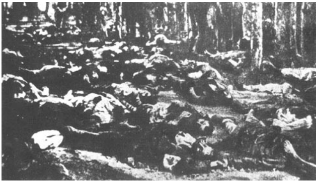
Κατακρεουργημένοι στήν ὑπαιθρο Ἀρμένιοι

Κλείσανε τά παιδιά καί τά μωρά, πού πιάσανε οἱ Τοῦρκοι, στοῦ τελωνείου τήν ἀποθήκη γιά νά τά προστατεύσουν. Ξέσκιζαν τήν καρδιά τά κλάματά τους. Κανείς δέν τά λυπήθηκε ἀπό ἐκείνους πού δῆθεν τά προστάτευαν. Τρεῖς μέρες οἱ φιλόθροποι, τά εἶχανε ἀτάιστα. Μιά νύχτα οἱ κραυγές καί τά τσιρίγματα πιάνουν τήν πόλη πού κοιμᾶται. Σιγά σιγά ἀραιώνουν κι ἀτονοῦνε οἱ φωνοῦλες. Ἀπ' τή μεριά τῆς θάλασσας φτάναν οἱ σπαραγμοί. Ὅλα τά πνίξαν στ' ἀνοιχτά οἱ ἄσπλαχνοι οἱ Τοῦρκοι. Γεμάτη ἦταν τό πρῶι νεκρά κορμάκια ἢ παραλία. Πάνω σέ τοῦτα τά κορμιά κάμανε οἱ Νεότουρκοι τά πρῶτα βήματά τους. Τά δημοκρατικά τούς βήματα. Ἔτσι ἀπλά καί ἤρεμα διώξανε τούς Αρμένιους ἀπό τόν Πόντο κι ἀπό τήν Τραπεζοῦντα. Μέ ἐκτοπίσεις καί σφαγές ἀφάνισαν ἓνα ὀλόκληρο ἔθνος.